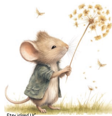
Etsy Ireland UC

Mittwoch, 16. April, 14.00 Uhr, Ökumenisches Zentrum Kehrsatz