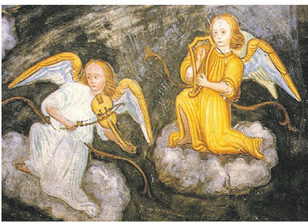
*Wandmalerei 16. Jahrhundert, Musizierende Engel, San Bernardo bei Monte Carasso, Schweiz

Deshalb habe ich mich entschieden, meine Pfarrstelle auf Ende April zu kündigen und meiner Gesundheit erste Priorität zu geben. Ich verabschiede mich von Ihnen mit einer Kunstkarte*. Sie steht auf meinem Schreibtisch zu-