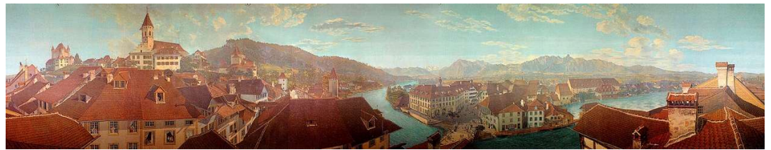
Marquard Wocher, Das Panorama von Thun und dessen Umgegend 1809–1814 (Detail)

Unter fachkundiger Führung erleben wir das Thun-Panorama. Danach geniessen wir ein Zvieri im Restaurant Schloss Schaudau.